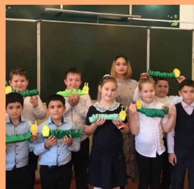
Начальное техническое объединение

программам дополнительного образования в электронном виде. Огромным плюсом данной системы является доступность всех дополнительных общеобразовательных программ в регионе для детей и родителей. Но в тоже время наша организация столкнулась и с трудностями: некоторые родители действительно не хотят регистрироваться, при этом педагоги выдают и памятку о том, как это легко можно сделать, и ведут с родителями информационно-разъяснительную работу, но все тщетно, еще одной проблемой является то, что номинал сертификата не безграничен. Поэтому родители вместе с обучающимся должны выбрать кружок, на который будет ходить ребенок, или если сертификат не покрывает стоимость занятий в полном объеме, родители должны доплатить недостающую сумму. Но в тоже самое время данный минус позволяет создать «здоровую» конкуренцию объединений дополнительного образования. Если подытожить все, то можно сделать вывод, что АИС «Навигатор ДОД» своевременен, актуален, легок и доступен в обращении пользователей, просто нужно научиться умело и грамотно им оперировать.