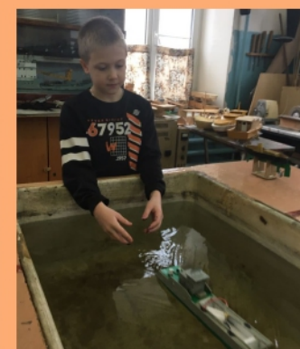
Судомодельное объединение «Верфь»